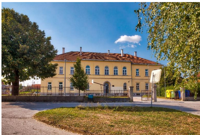
Srednja škola Slunj u 21. stoljeću – nositeljica srednjoškolskog obrazovanja slunjskog područja

Srednja škola Slunj, nakon oslobađanja okupiranih područja, nastavlja radom 1996. godine i postepeno s povratkom prognanika, kvalitativno i kvantitativno se razvija i ugrađuje u postojeći hrvatski obrazovni sustav, pritom intenzivno radeći na stvaranju i razvoju materijalnih i kadrovskih uvjeta. Škola se od devedesetih godina prilagođava potrebama lokalne zajednice za deficitarnim kadrovima.