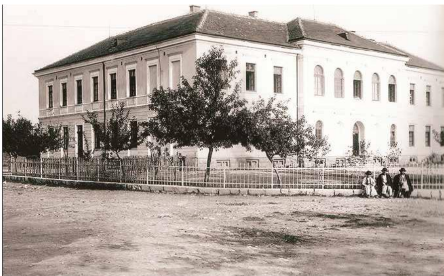
Slunjska građanska škola u 19. stoljeću

Tijekom dugog razdoblja Slunj je bio jedan od najisturenijih dijelova Hrvatske prema turskoj granici. Od 16. stoljeća bio je uključen u sustav Vojne granice u kojoj je društveni ustroj bio podređen vojno-obrambenim potrebama. Teško je vjerovati da je u vrijeme stalnih ratnih opasnosti bilo obrazovanja u Slunju. Postoji mogućnost da je u sklopu franjevačkog samostana djelovala crkvena škola, ali o tome nema izvora.